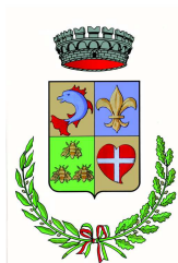
Comune di Pragelato